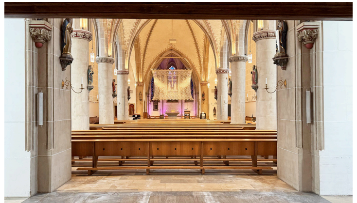
St. Dionysius, Nordwalde, Blick zum Altar (oben) und Blick zum Gestaltungsareal unter der Orgelempore

Die Teilnehmenden müssen die eingereichten Arbeiten selbst entworfen und ausgeführt haben. Arbeiten, die üblicherweise nur unter Mitwirkung anderer gestaltet werden können, müssen maßgeblich von den Teilnehmenden beeinflusst worden sein. Eine Teamarbeit bei Entwurf und Ausführung ist zulässig, muss jedoch auf der Teilnahmeerklärung vermerkt werden.