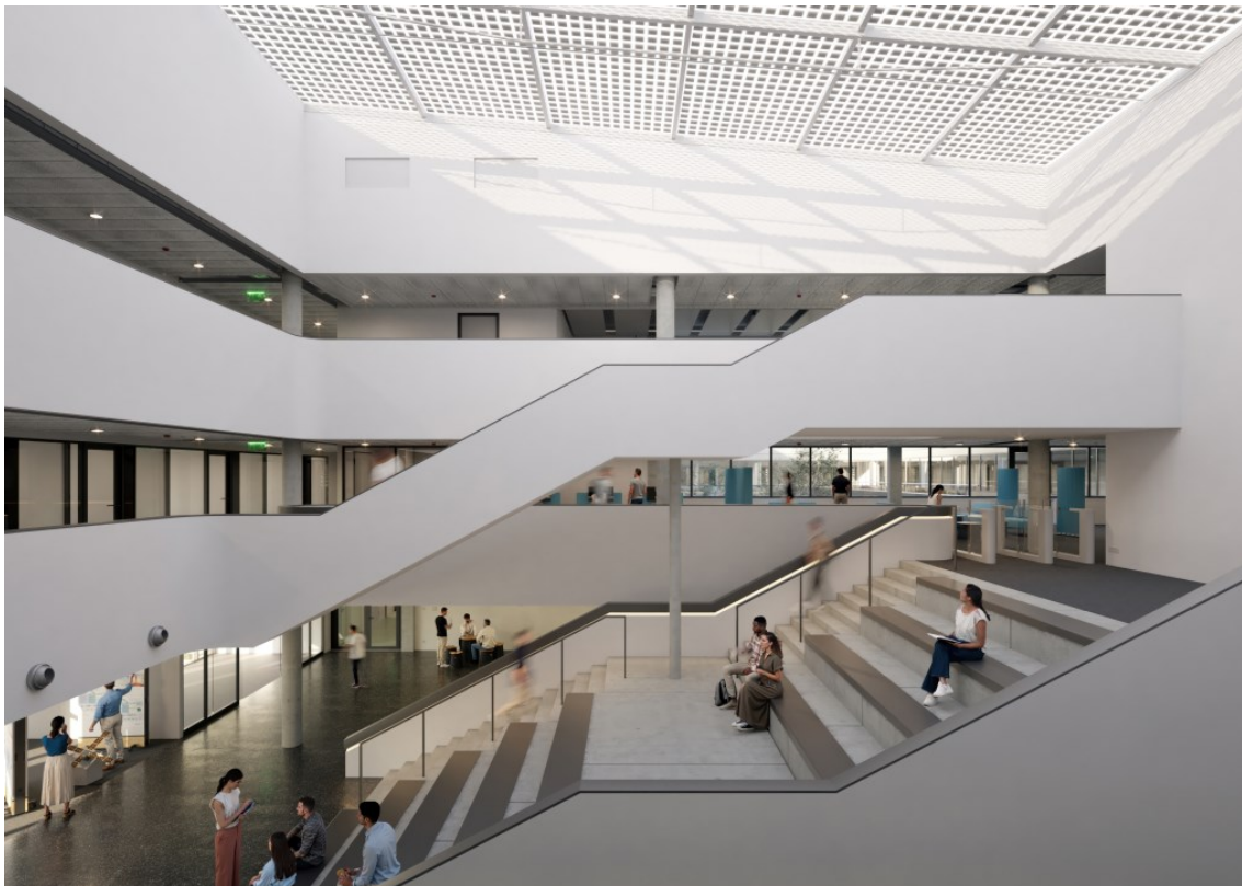
(Visualisierung / Atrium mit Sitztreppe und Ausstellungsbereich)

Im Atriumbereich ist eine Ausstellungsfläche für Darstellung der Entwicklungen in der Forschung vorgesehen.